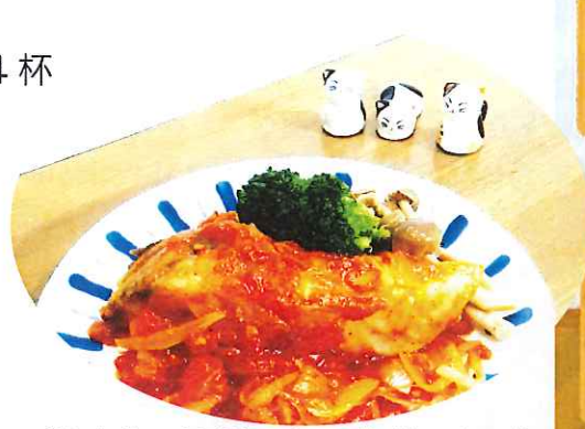
【1人分 358kcal 塩分 1.4g】