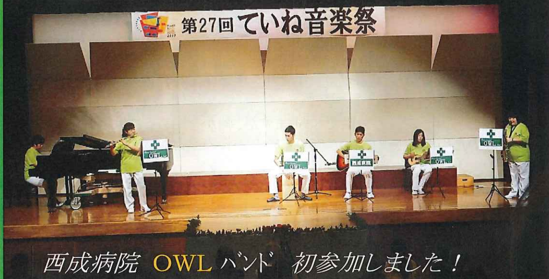
西成病院 OWL バンド 初参加しました！

以上の権利を守るため、患者さまは病院職員と力を合わせて医療に参加・協力する義務があります。